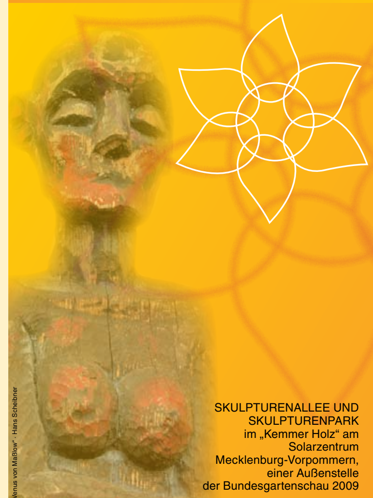
„Venus von Maßflow“ · Hans Scheibner

Von der Ritterburg bis zum solaren Technologie- und Gewerbezentrum